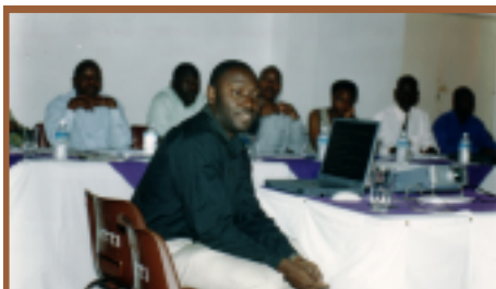
Uganda: Seminário de Abertura de Sensibilização e Formação

A Trindade e Tobago solicitou uma missão durante o terceiro trimestre, para formação dos quadros em