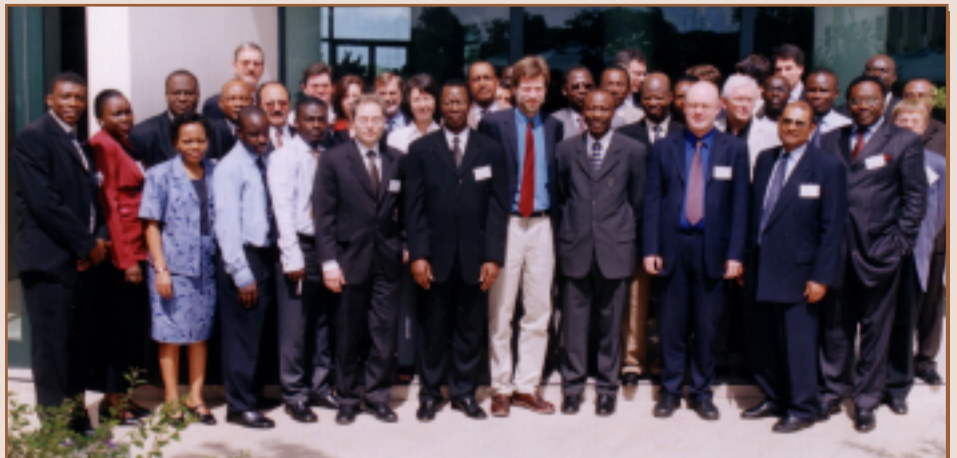
14 e Réunion du Comité exécutif du PRC PPTE

La réunion a également traité des progrès accomplis dans la création d'un Institut PALOP, destiné à offrir une formation complète aux pays PALOP en langue portugaise. Les gouvernements PALOP ont terminé un document de projet et se sont engagés à