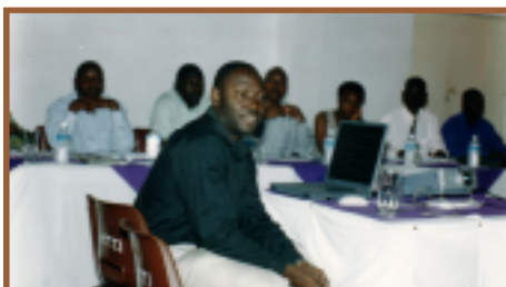
Séminaire inaugural ougandais de sensibilisation et de formation

A u deuxième trimestre 2004, la Bolivie, le Kenya, l'Ouganda et Trinité-et-Tobago ont entamé un nouveau cycle ; le Malawi et la Tanzanie ont achevé leurs cycles en cours ; tandis que six autres pays ont finalisé leurs demandes de participation. Le PRC CEP a progressé considérablement en matière de méthodologie et a conduit une deuxième évaluation des capacités.