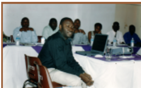
Uganda: Seminario de Apertura de Sensibilización y Capacitación

Tanzania está finalizando su primer ciclo dentro del marco de la fase II. MEFMI/DFI condujeron una misión en abril para apoyar a Tanzania con la capacitación sobre análisis avanzado y redacción de informes. Tanzania está proporcionando mayores fondos para el ciclo 2 (encuestas muestrales), y está movilizandofondos de donantes para costos internacionales.