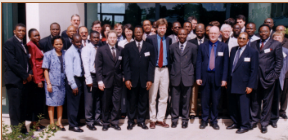
14ª Reunión del Comité Directivo del PFC HIPC

Asimismo, se informó a la reunión sobre el progreso alcanzado con el Instituto PALOP , cuyo objeto es ofrecer una capacitación amplia a los países PALOP en el idioma portugués. Los gobiernos de las naciones PALOP habían terminado un documento proyecto, habiéndose